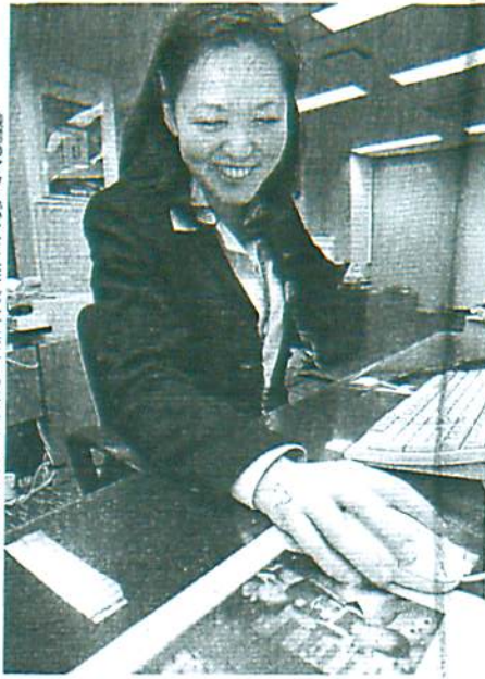
職場のマスパッドに映る女子供たちの写真に目をやる人相屋

総務省の労働力調査(07年)によると、働く女性の内訳は「正規雇用者1039万人、パートや派遣社員など非正規雇用者が194万人だ。非正規の割合は85年