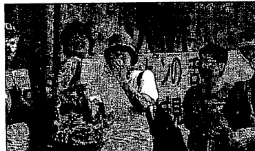
2009年8月に行われた「オンナハケンの乱」は人材派遣協会までデモした

ほかには、無いたのは「雇用社会保険の加入を徹底させます」というパンプンで「労働・社会保険の加入状況のアンケート調査を100万人以上居住する派遣労働者のうち約441人のアンケートには、あまりにサンプル数が少ない回答も偏っている。これもまた、「サンプルを偏らす」という手法の典型例で、初めから労働、社会保険に加入している派遣労働者をピックアップしてアンケートをとれば、このような結果が出る。これは、私が派遣で働いた体験では、派遣された6社のうち、労働・社会保険への加入手続きがされたケース